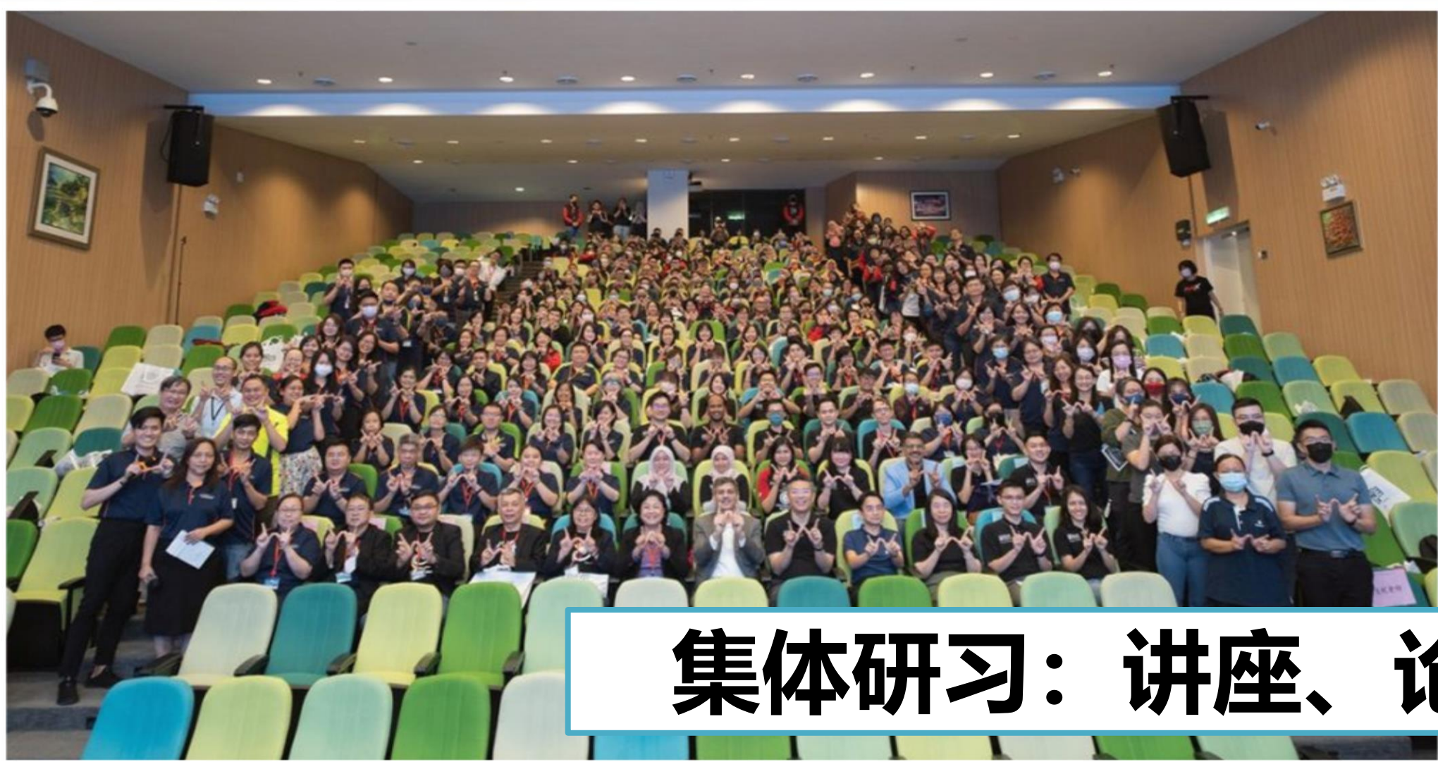
集体研习：讲座、论坛