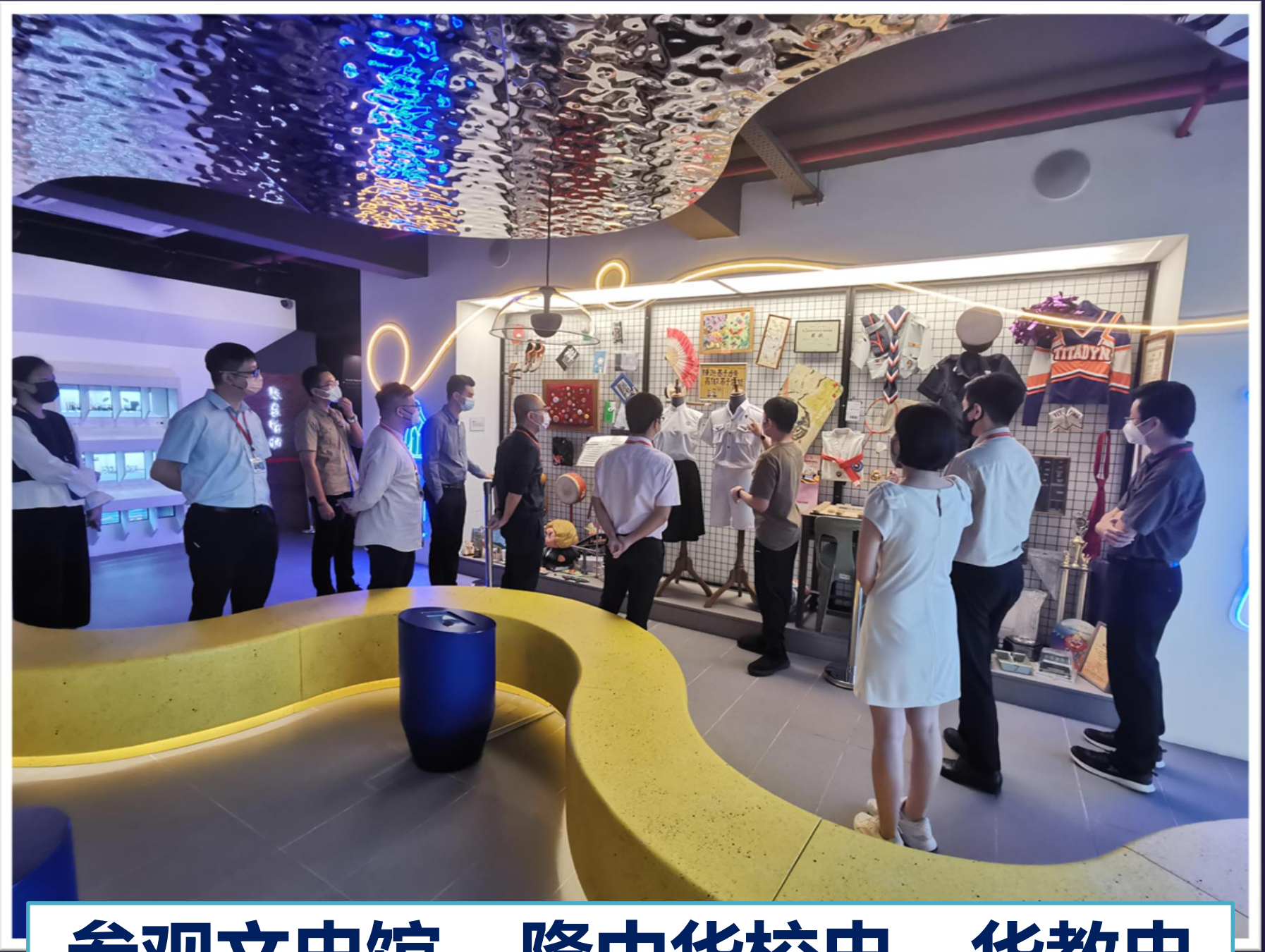
参观文史馆 - 隆中华校史、华教史