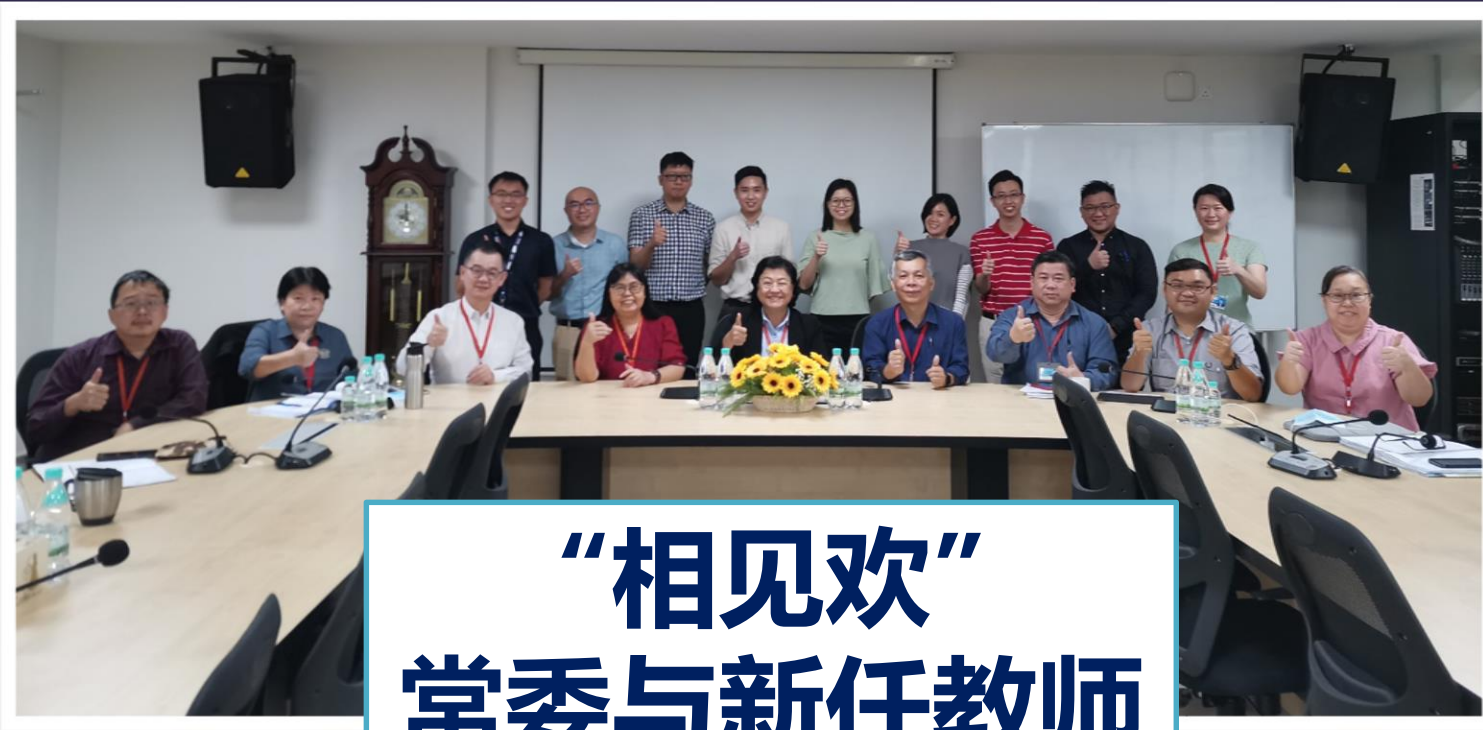
“相见欢” 常委与新任教师