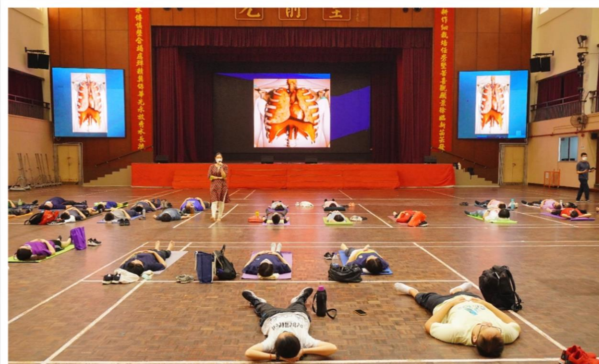
正念 - 身心减压技巧